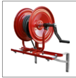
Enrouler 50 m