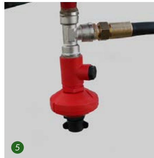
1. Kopf mit Sprühvorrichtungen und hydraulischen AlbuZ-Düsen. 2. Regelarmatur mit Handschaltungssteuerung 3. Filtri di mandata prima dei getti / Druckfilter vor den Düsen