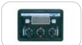
Monitor velocità Km/h, portata l/min - l.tot , tempo(h)