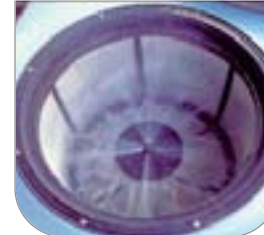
Miscelatore per prodotti in polvere