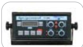
Computer per la distribuzione proporzionale all'avanzamento