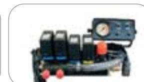
Comando a distanza elettrico mod. ARAG (12 Volts) con regolazione elettrica e manometro in cabina