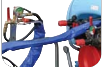
Comando a distanza manuale