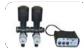
Comando a distanza elettrico a 2 vie TEEJET