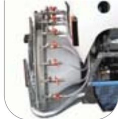
Testata a diffusori con antigoccia a membrana