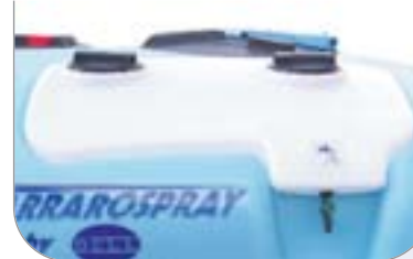
Circuito di lavaggio dei residui chimici