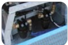
filtri in linea prima dei getti