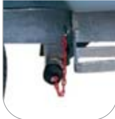
Valvola di scarico a normativa CE