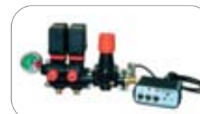
Comando a distanza elettrico mod. ARAG (12 Volts)