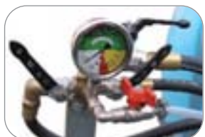
comando a distanza manuale