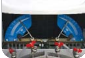
Distribuzione calibrata "METERING SYSTEM"